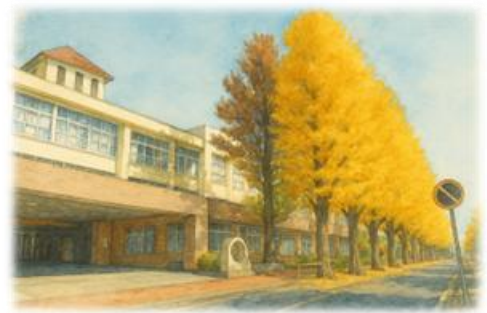
いちよう並木と学校(画・生成AI)

本日は終業式でした。児童・生徒の皆さん一人一人に「学期のまとめ」「通知表」をお渡ししました。ぜひお子様と一緒に御覧いただき、2学期の成長を振り返ってみてください。