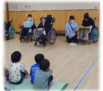
園児たちにクリスマスソングのプレゼント

11月26日、肢体不自由教育部門高等部準ずるグループの生徒たちは、学校のお向かいにある小川西保育園で園児たちに読み聞かせをする社会貢献活動を行いました。保育園では、元気な園児たちが部屋に集まり、お兄さん、お姉さんたちが来るのを今か今かと待っていました。最初は少し緊張気味だった高等部の生徒たちも、次第にリラックスして、紙芝居の読み聞かせとクリスマスソングを披露しました。ちょっと早いクリスマスプレゼントに園児たちも大喜び。最後はたくさんの拍手とともに「また来てね!」と声をかけられ、満足そうな生徒たちでした。「人に喜んでもらう」「人の役に立つ」、そんな経験を通して自己肯定感、自己有用感を育ててほしいと願っています。