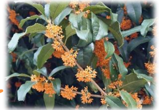
中庭のキンモクセイ

長かった残暑もようやく収まり、金木犀の甘い香りとともに、一気に秋が訪れました。「スポーツの秋」「芸術の秋」「読書の秋」「食欲の秋」…。秋は、何をすることも気持ちの良い季節ですね。早いもので2学期も振り返り地点を過ぎました。後半も児童・生徒の皆さんが楽しく充実した学校生活を送れるよう、日々の学習や行事などを通して支援してまいります。