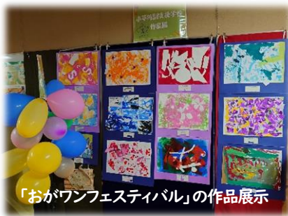
「おがワンフェスティバル」の作品展示

小平特別支援学校では、近隣の学校との交流など、地域とのつながりを大切にしています。そんな中10月11日(土)、12日(日)に開催された「小川西町公民館まつり」では、肢体不自由部門小学部の児童の作品を展示していただきました。また、10月26日(日)には特別養護老人ホーム小川ホーム主催の「おがワンフェスティバル」にて、肢体不自由教育部門高等部の生徒の作品を展示させていただきました。どちらのイベントも多く地域の住民の方々が訪れ、興味深そうに本校児童・生徒の作品を鑑賞したり、学校紹介に目を通したりしてしていました。現在、学校の正面玄関前の掲示板では、病弱教育部門病院訪問部の授業紹介を掲示しています。また、11月に